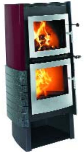
xeoos BIG CLASSIC

Viel Wärme für große Räume haben die Kaminöfen der xeoos BIG-Serie. Sachlich-elegant im Edelstahlkleid der xeoos BIG PUR. Hell und freundlich der xeoos BIG NATUR mit Trachit-Speicherstein und farbigen Seitenteilen. Edel und souverän der xeoos BIG CLASSIC mit schwarzgrünem Diabas. Als exklusives Designmodell der xeoos BIG DESIGN mit integrierten Bedienelementen.