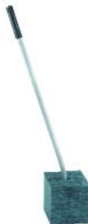
Feuerhaken mit Fußständer