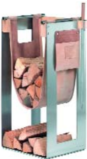
Holzrack komplett mit Ledertasche, Spantasche und Feuerhaken

Ein abgestimmtes Zubehör-Set bietet alles, was Sie für jedes gute Feuer brauchen. Ein großes Holzrack und dazu passend eine schicke Holztrage aus Leder. Der Feuerhaken ist nach dem bionischen Prinzip entwickelt. Er folgt der Form einer Adlerkrallen und ist einfach praktisch. Er wird bequem geparkt im Fußständer aus Stein oder elegant in der Wandhalterung aus Glas fixiert.