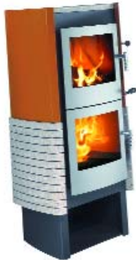
xeoos BIG NATUR