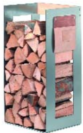
Holzrack solo Spantasche optional