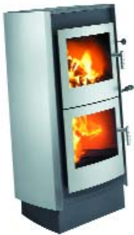
xeoos BIG PUR